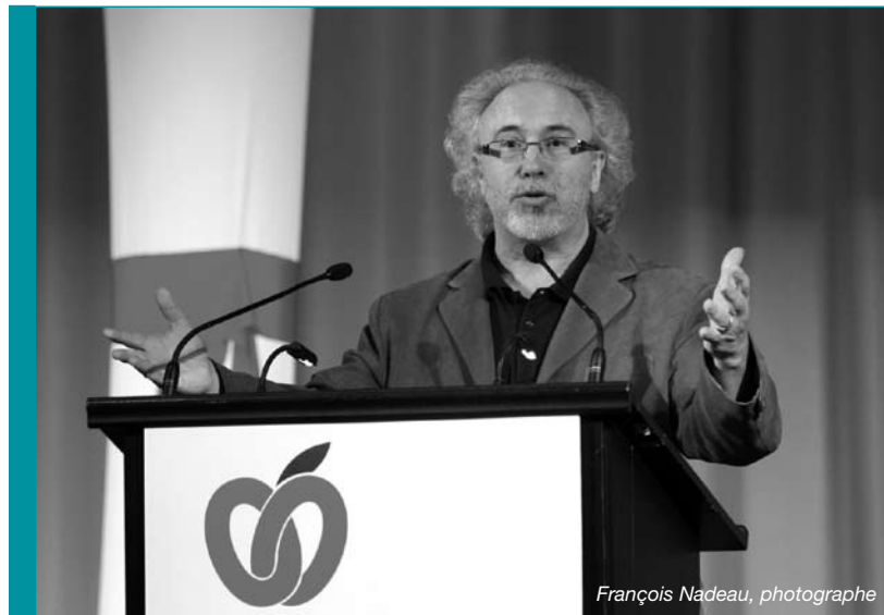
François Nadeau, photographe

« Pour être connu, le commissaire doit être dans le trafic, il faut qu'il se voie dans l'espace public. »