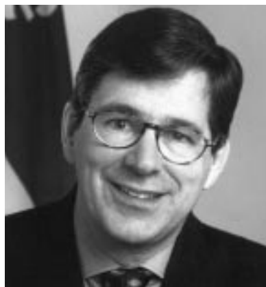
Sylvain Simard Ministre de l'Éducation

Nous vivons, dit-il, un partenariat efficace qui s'est amélioré depuis la Loi sur l'instruction publique. « Nous avons trouvé un bon équilibre, que ce soit au regard des grandes orientations du ministère, des plans de réussite, de la réforme, de la lutte à la pauvreté. Les écoles sont devenues plus autonomes et les commissions scolaires les soutiennent dans les services qu'elles rendent à la population. »