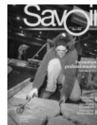
Volume 11, numéro 3 Mars 2006 (Document 6521)