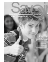
Volume 11, numéro 1 Septembre 2005 (Document 6482)