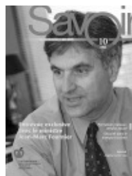
Volume 10, numéro 4 Juin 2005 (Document 6472)

Publication de 4 numéros du magazine Savoir