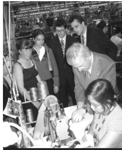
5 000 élèves ont participé au programme de visites d'entreprises des Manufacturiers et Exportateurs du Québec, en collaboration avec la FCSQ.