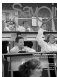
Volume 11, numéro 2 Décembre 2005 (Document 6506)